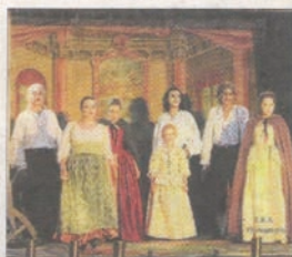
■ "Le malade imaginaire" est joué par la troupe de l'Illustre Théâtre ce soir.