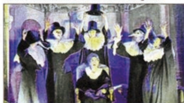
Le malade devient médecin