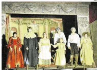
La troupe au complet